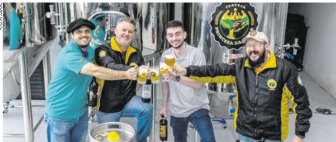
Enfim a novidade cervejeira do ano: A partir de agora nós #CervejaPrincesadaSerra e @bier.letti somos uma empresa só!